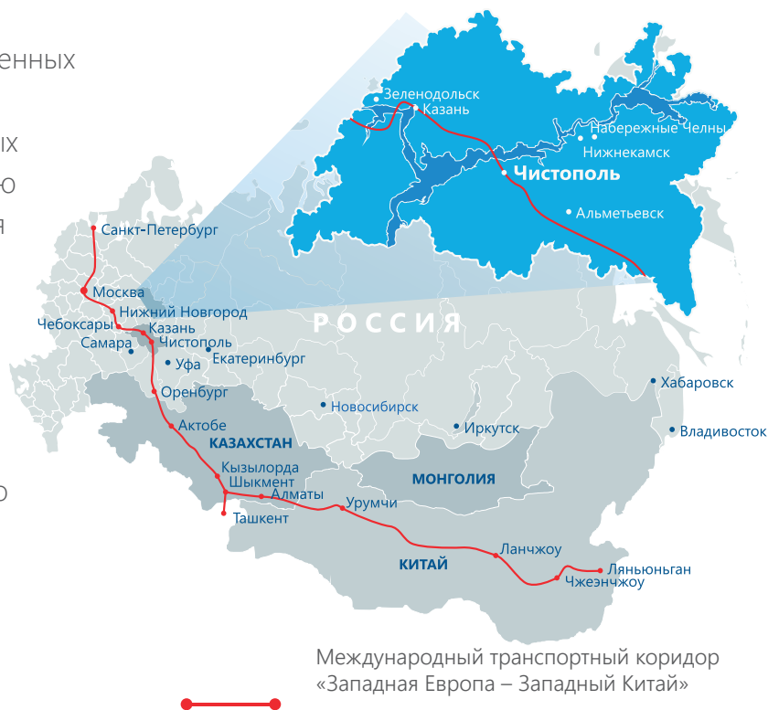
Международный транспортный коридор «Западная Европа – Западный Китай»

расположен в центральной части Республики Татарстан в г. Чистополь, имеющем статус территории опережающего социально-экономического развития. Через г. Чистополь будет проходить международный транспортный коридор «Западная Европа – Западный Китай».